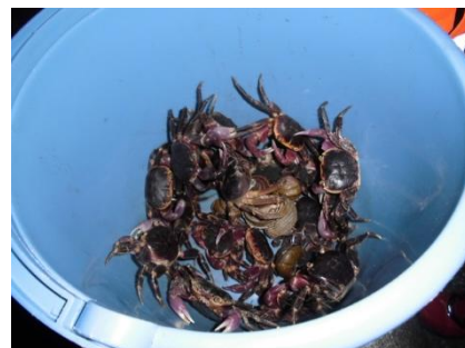
たくさんのカニを救出です