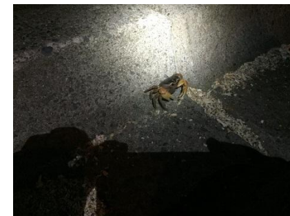
道脇でカニさん発見！救出します