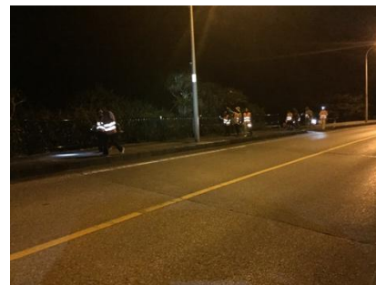
注意して暗い道路での活動